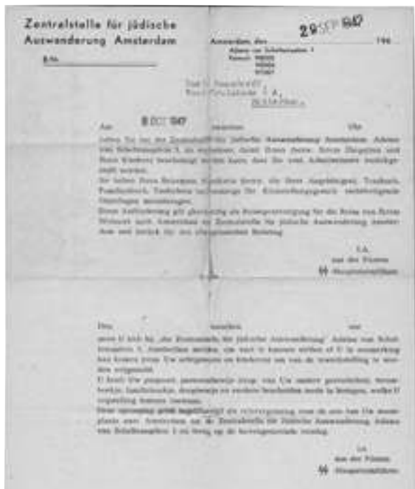
מסמך מס' 6