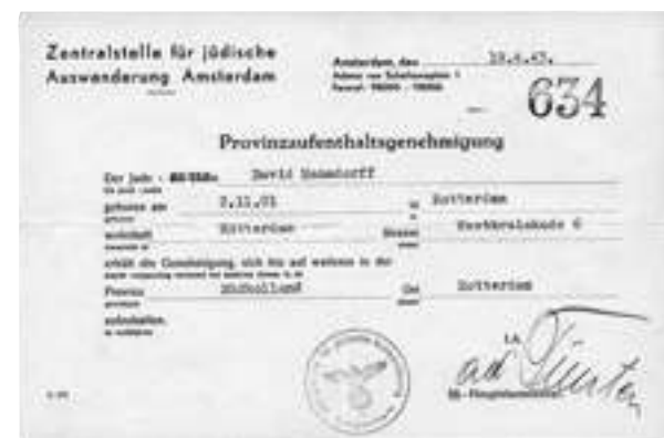
מסמך מס' 7