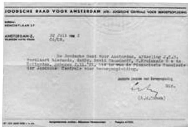
מסמך מס' 3

המסמך בתמונה מס' 4 שנושא תאריך 24/7/1942 אנו רואים אישור של היודנראט, בו מוצהר כי האוסדורף מועסק על ידה כיועץ רפואי וחבר בוועדה הפיננסית. פריט זה נרכש ב-1,500 דולר.