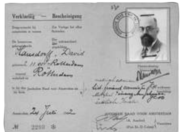
מסמך מס' 4

מסמך מס' 6 הינו מסמך מעניין, כי הוא מגולל בתוכו את התקדמות הגירוש של יהודי הולנד והתהדקות הטבעת גם מסביב מיודענו האוסדורף. ב-29 ספטמבר 1942 הוא מקבל זימון להופיע בפני הלשכה המרכזית להגירה [קרי: גירוש] יהודית (Zentralstelle für jüdische Auswanderung), לא יאוחר מ-8 אוקטובר 1942. מטרת פקודת ההתייצבות הינה קביעה באם הוא, רעייתו וילדיו עדיין פטורים מ"שילוח לעבודה" [גירוש והשמדה]. גם כאן דרושה הערת הבהרה: למרות שוועידת וואנזה (Wannsee), בה הוחלט על "הפתרון הסופי", נערכה כבר בסוף ינואר 1942, ובמרוצת אותה שנה פעלה מכונת ההשמדה כבר במלוא קיטורה, לא היו עדיין ידיעות ברורות אודות גורלם הסופי של יהודי הולנד שגורשו למזרח. מעובדת קיומו של המסמך הבא אנו למדים כי האוסדורף קיבל את האישור המיוחל. מכתב זה נמכר ב-725 דולר.