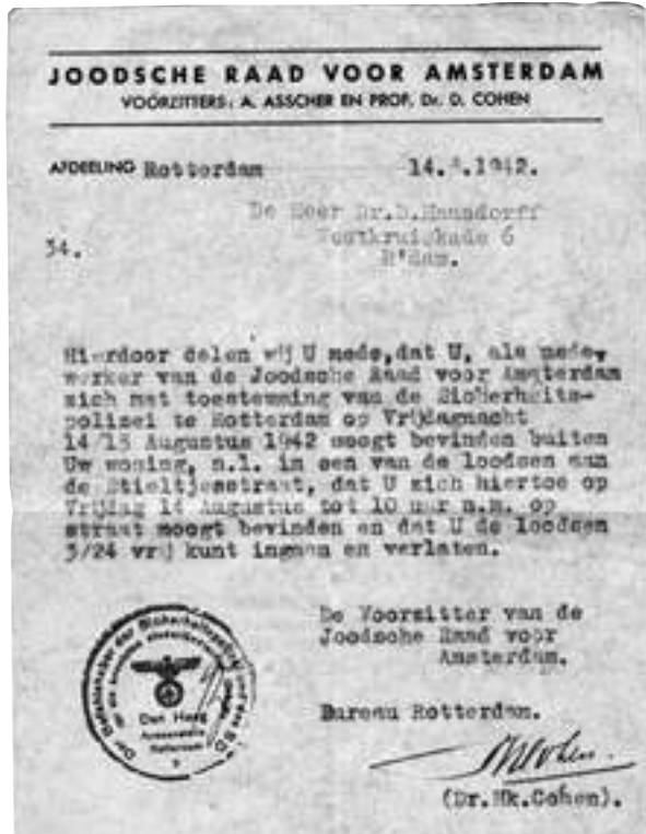
מסמך מס' 5

הולנד, שנידון למוות לאחר המלחמה אך זכה לחנינה ונשלח לחופשי לאחר כ-45 שנות מאסר. התעודה נרכשה במחיר 750 דולר.